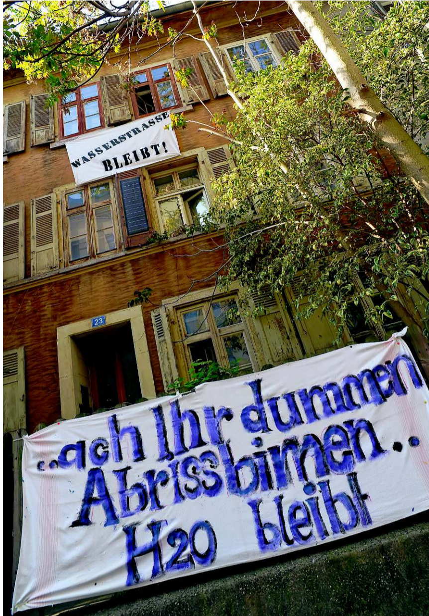
Der Wohnungsmarkt sorgt für Spannungen: Bewohner der Wasserstrasse kämpfen gegen den Abriss günstiger Wohnungen.

Doch: Wird Wohnraum knapp, steigen die Mieten. Kessler relativiert und beruft sich auf eine Studie des Bundes, wonach die Mieten in Basel zwischen 2005 und 2010 um 7 Prozent gestiegen sind. «Das ist moderat