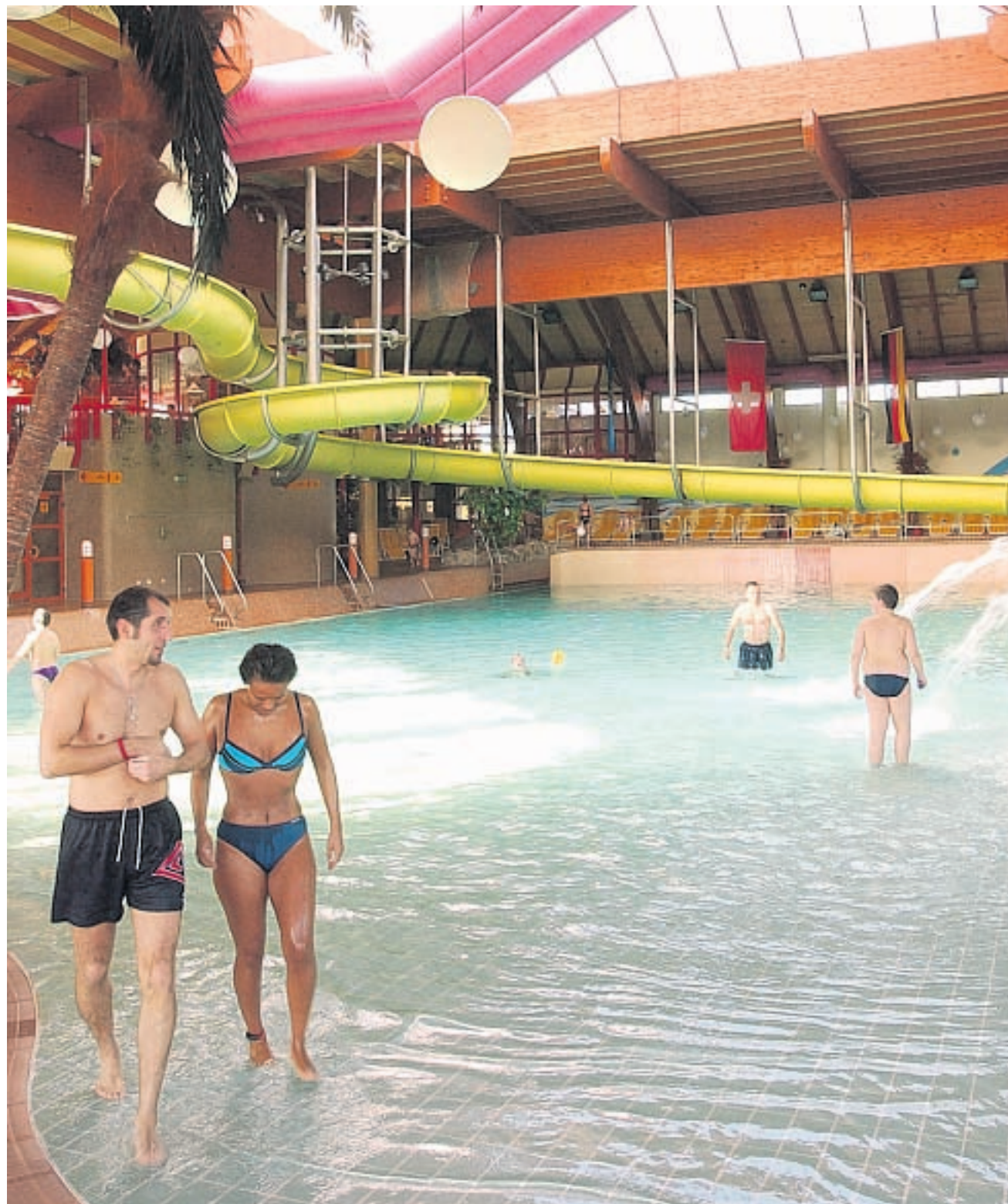
In die Jahre gekommen. Aquabasilea und Badeparadies machen dem Weiler Hallenfreizeitbad Konkurrenz.

Weiler Badeland schliesst für 16 Monate wegen dringend notwendiger Modernisierung