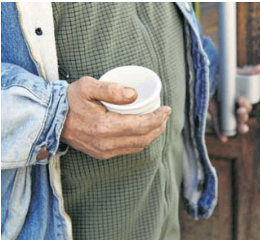
Mehr Bettler. Die Polizei hat in den vergangenen Wochen auffallend viele Bettler in der Basler Innenstadt gezählt. Kontrollen und Bussen nützten wenig.

Das Problem habe sich mit dem Beitritt der Schweiz zum Schengen-Raum verschärft, sagt Josef Stalder, Leiter Zwangsmassnahmen im Justiz- und Sicherheitsdepartement. «Früher konnte man mit Einreiseverboten operieren.