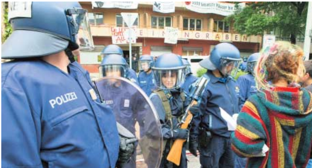
Ungebetene Gäste. Mit einem Grossaufgebot kam die Polizei gestern vor dem stillgelegten Hotel an – und räumte es.

Basel. Nach der Räumung randalierten andere Autonome vor einem Polizeiposten