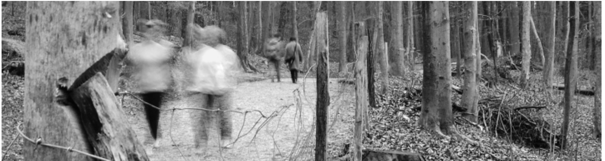
SCHUTZ. Klettern, biken, reiten, wandern: Der Wald ist ein beliebter Ort für Freizeitaktivitäten. Nimmt ihn der Mensch jedoch zu stark in Beschlag, leidet er, der Lebensraum von Tieren und Pflanzen wird tangiert. Das Forstamt beider Basel möchte deshalb die Freizeitakti-