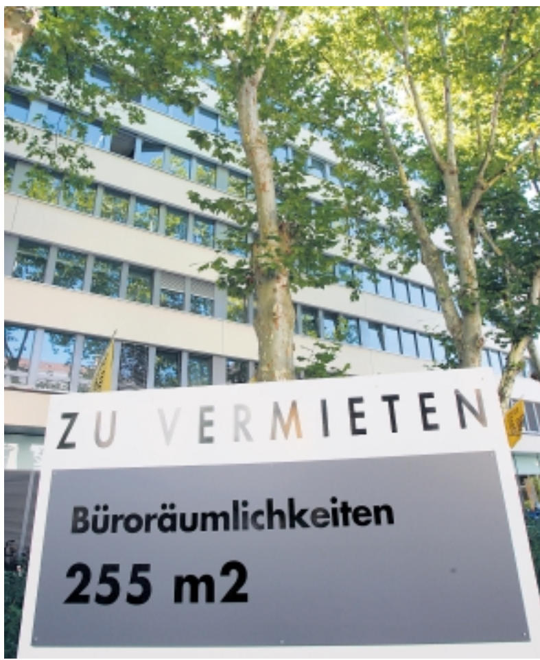
Auf Halde. Wer Geschäftsräume sucht, wird in beiden Basel rasch fündig.